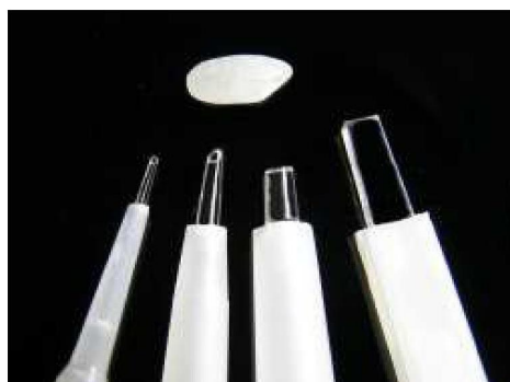
ペタスティック4種の大きさ比較（上は米粒）