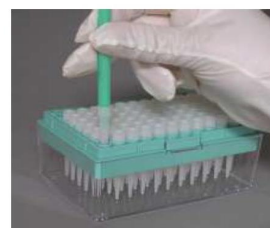
専用軸により、先端に全く手を触れず、クリーンなまま、ご使用になれます。